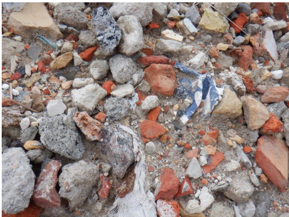
Fot. 5. Odpady materiałów budowlanych z domieszkami innych opadów z Niemiec