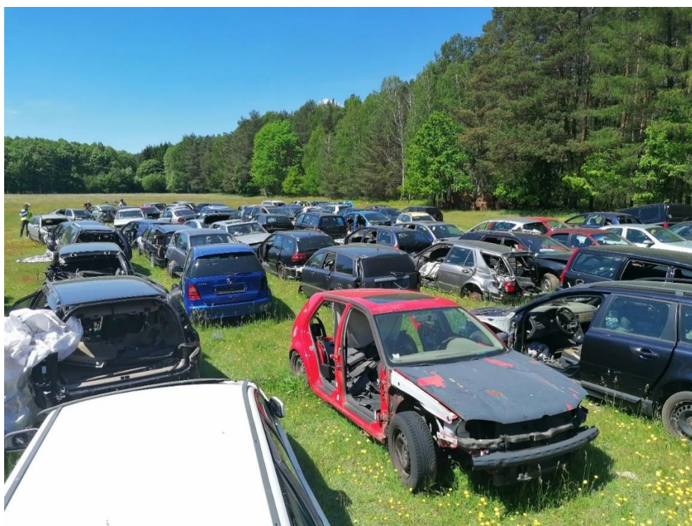
Fot. 3. Miejsce magazynowania częściowo zdemontowanych pojazdów w miejscowości Rapin, gmina Drezdenko

Dzięki współpracy z KWP w Gorzowie Wlkp. ustalono, że wszystkie pojazdy zostały sprowadzone z zagranicy i nie zostały zarejestrowane na terytorium RP. Ponadto dzięki współpracy z inspektorami Urzędu Skarbowego w Drezdenku ustalono, że zarówno kontrolowany przedsiębiorca, jak również jego pracownicy sprzedawali w okolicznych skupach złomu znaczne ilości złomu pochodzącego z demontowanych pojazdów. Dzięki współpracy wielu służb polegającej w głównej mierze na wymianie informacji oraz przeprowadzeniu kilku kontroli krzyżowych, udało się zebrać materiał dowodowy potwierdzający m.in. proceder nielegalnego demontażu pojazdów, nielegalnego transgranicznego przemieszczania odpadów w postaci pojazdów wycofanych z eksploatacji oraz co najważniejsze popełnienie przez przedsiębiorcę przestępstwa określonego w art. 183 § 3 Kodeksu karnego polegający na zanieczyszczeniu gleby. Sprawa została zgłoszona do Prokuratury Rejonowej w Strzelcach Krajeńskich. Obecnie jest na etapie prowadzenia śledztwa. Powiadomiono także GIOŚ o nielegalnym transgranicznym przemieszczeniu odpadów w postaci pojazdów wycofanych z eksploatacji. Za stwierdzone podczas kontroli naruszenia zostaną wymierzone administracyjne kary pieniężne.