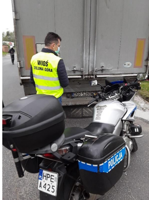
Fot. 7. Kontrola w miejscowości Mirocin Dolny wspólnie z funkcjonariuszami Policji

Udział w 3 akcjach prewencyjnych dot. TPO, tj. Odpady 2021, Demeter VII oraz w cyklicznych działaniach z funkcjonariuszami Policji, ITD i KAS pod kątem transportu odpadów w ruchu międzynarodowym i krajowym. Ilość kontroli transportów odpadów -128, w tym 30 transportów dot. TPO.