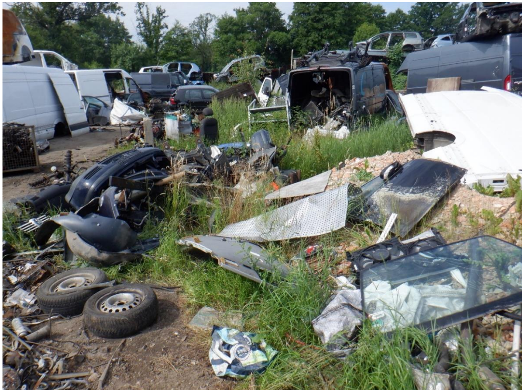
Fot.1. Działka nr 561/1 Mirostowice Górne (28.06.2021 r.) - zbieraniu odpadów bez wymaganego zezwolenia