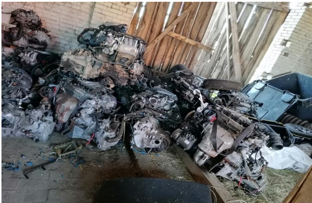
Fot. 4 Silniki pochodzące ze zdemontowanych pojazdów w miejscowości Rapin, gmina Drezdenko