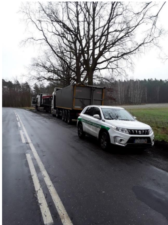
Fot. 8. Kontrola transportów odpadów w miejscowości Radwanów